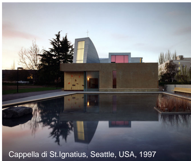
Cappella di St. Ignatius, Seattle, USA, 1997