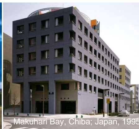
Makuhari Bay, Chiba; Japan, 1995