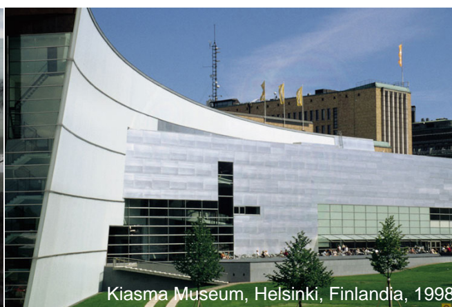
Kiasma Museum, Helsinki, Finlandia, 1998