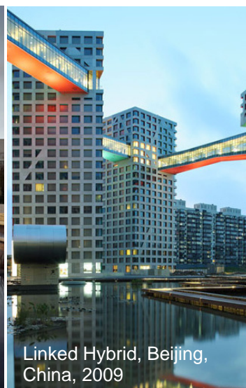
Linked Hybrid, Beijing, China, 2009