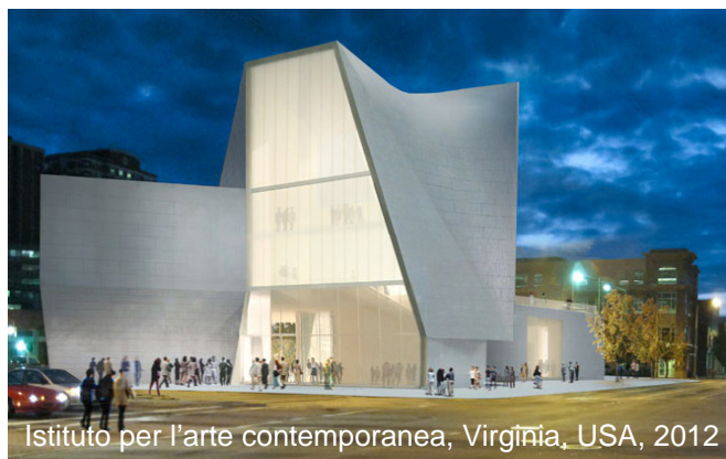
Istituto per l'arte contemporanea, Virginia, USA, 2012